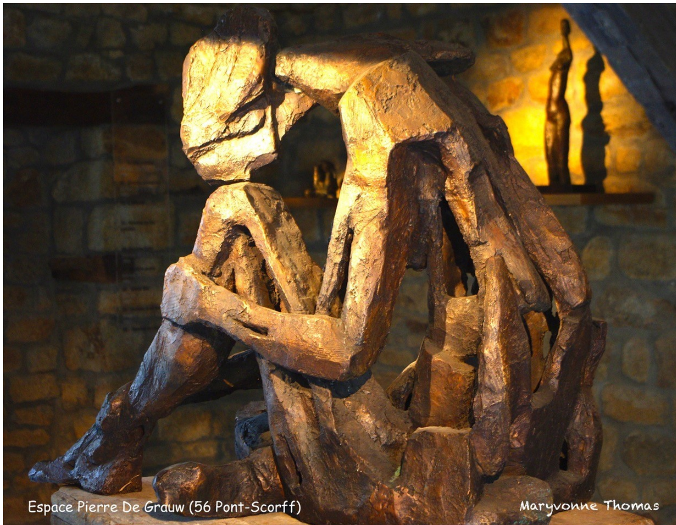
Espace Pierre De Grauw (56 Pont-Scorff)